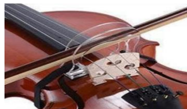
Коректор для ведення смичка

Заняття з початківцями необхідно розподіляти на частини, щоб учню було цікаво і він не втомлювалася від одноманітності, а саме: